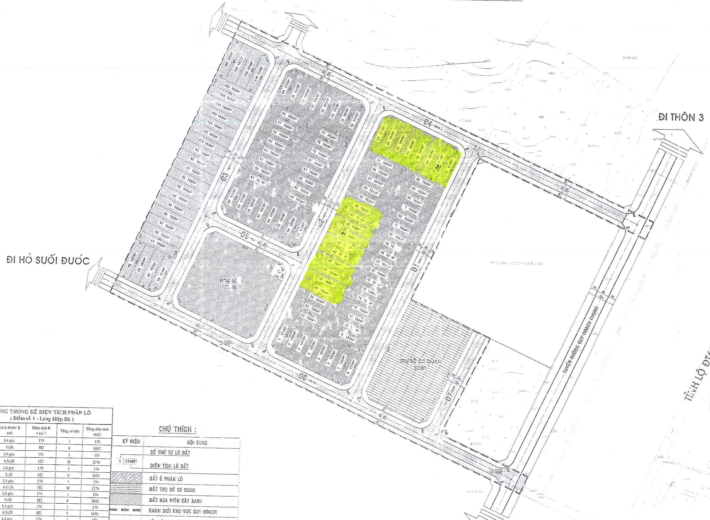
BẢNG THÔNG KẾ DIỆN TÍCH PHÂN LỘ ( Điểm số 1 - Làng Hiệp Hà )